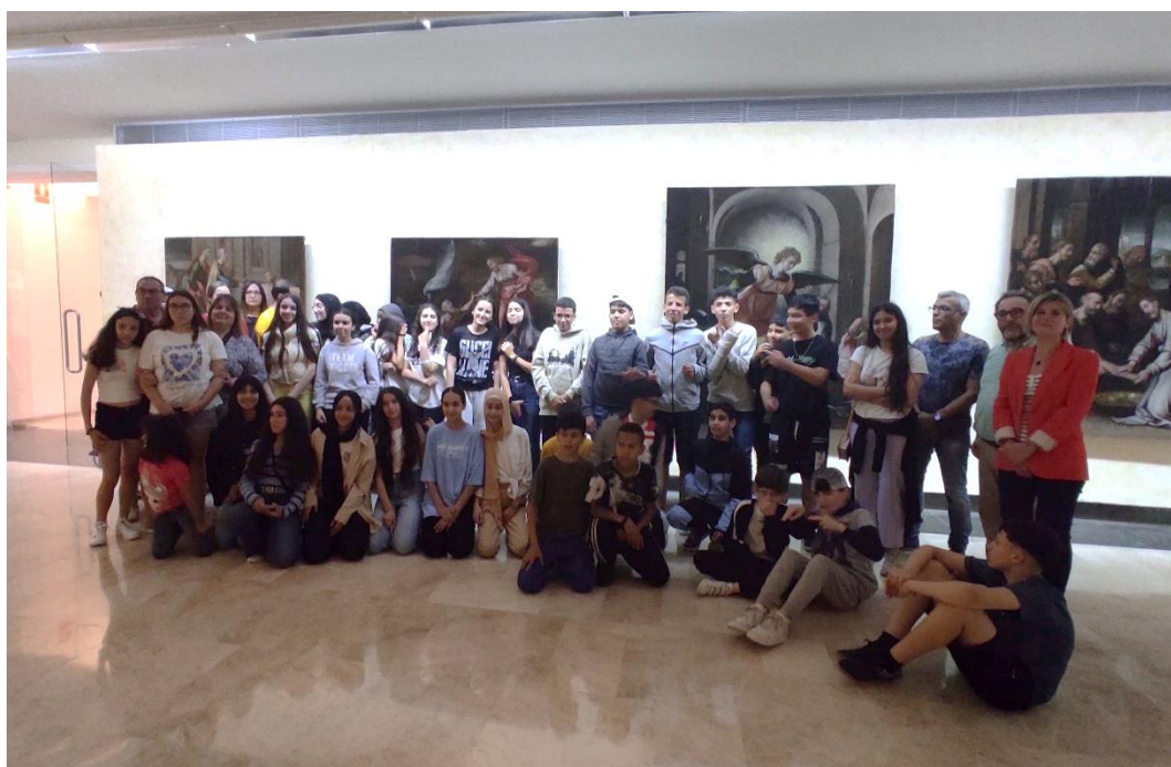
Inauguració de l'exposició "L'altre Tapiró al Museu" Museu de Reus. Institut Josep Tapiró