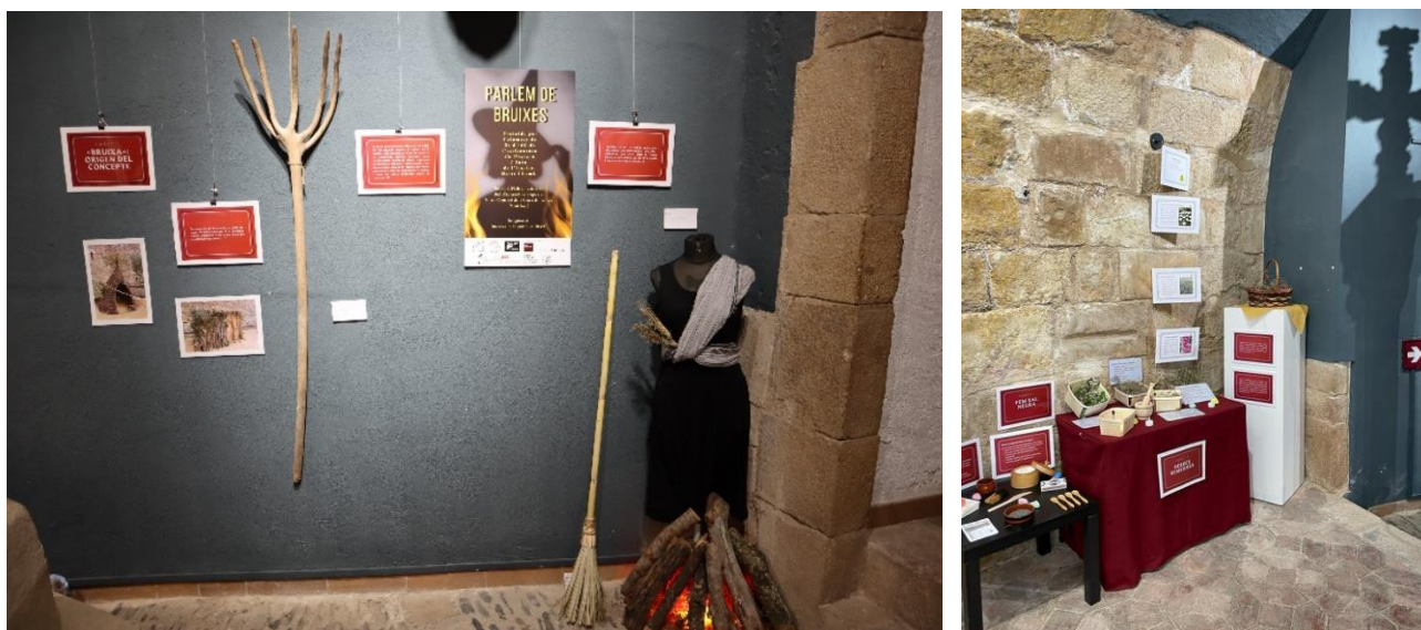
Inauguració de l'exposició "Parlem de bruixes" Museu Comarcal de la Conca de Barberà. Institut Martí l'Humà

En les experiències realitzades en el marc del programa aproPA'T en les que l'exposició s'ha realitzat en el propi museu, és una bona manera per apropar encara més aquesta institució a l'alumnat i que se la sentin seva.